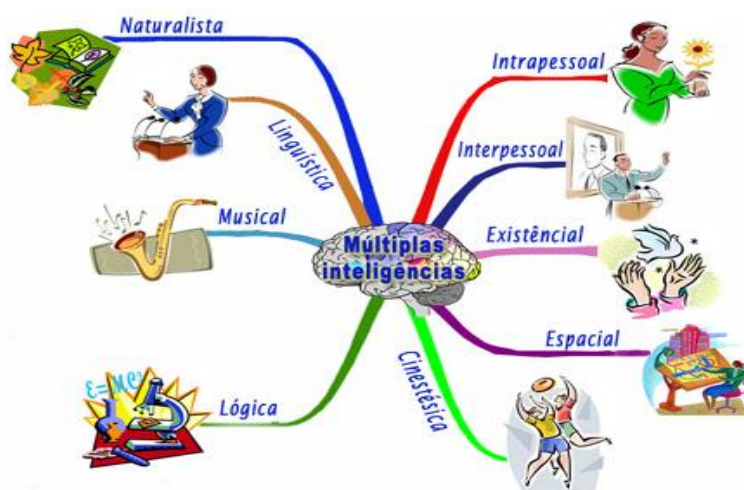
Figura 1: Esquema das inteligências múltiplas

Em suas conclusões, a princípio, levaram à existência de sete tipos de inteligências, que evoluíram com a inclusão das duas últimas, naturalista e existencial, a serem citadas na listagem abaixo: